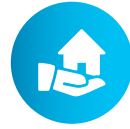
Fweyi di swin di long djuri