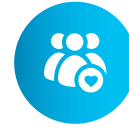
Swin di domsil ipi swin di komunotayr