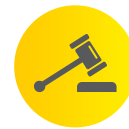
L'sujet d'ayn kowr