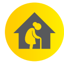
D'ayn minzon di ritrayt